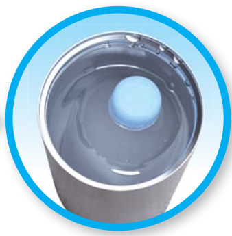
専用ボトルに冷水を ボトル半分ほど入れます