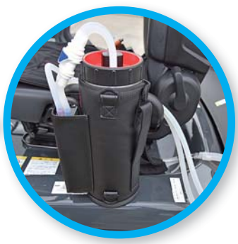
各カプラーを繋ぎ電源を入れて 循環の確認をします