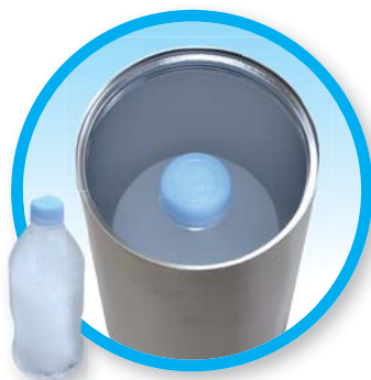
専用ボトルに凍った ペットボトルを入れます

バッテリーについて：100V コンセントで約 4 時間で充電完了、連続運転で約 15 時間お使いいただけます。