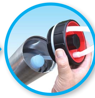
冷却が弱くなったら 冷凍ペットボトルを交換します