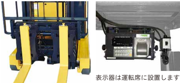
表示器は運転席に設置します。

ご使用中のフォークリフトに取付けて使用可能です。フォークのバックレストのブラケットにスケール本体を取付け、運転席に付けた表示機と接続します。国家検定対応で取引証明に使用できるフォークリフトスケールです。