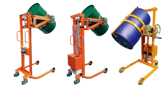
ハンドドラムリフト 電動ドラムリフト 樹脂ドラム用リフト