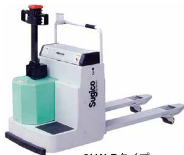
2LW-Rタイプ ライドオンで移動時の作業性アップ ※写真はオプション装着車（ペン立て）です。 杉国工業