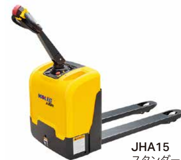
JHA15 スタンダードタイプ 中西金属工業