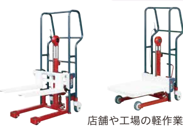
店舗や工場の軽作業に最適 200~450kg積 フォークタイプ・テーブルタイプ