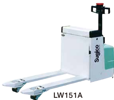
LW151A 4輪支持の高安定タイプ 杉国工業