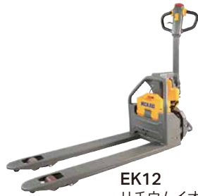
EK12 リチウムイオンバッテリー搭載 のローコストタイプ 中西金属工業