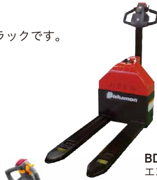
BDH15 エコノミータイプ スギヤス