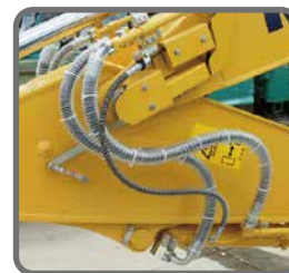
3年弱で紫外線焼けをして変色しますが、機能には問題ありません。