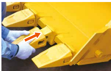
① 既存の横ピン用アダプタに専用ツースをセット

ピンとブッシュをツース両側から装着 ⇒ ボルトを締めるだけ! ※取外しは③→①の作業で安全・迅速・簡単に取外し