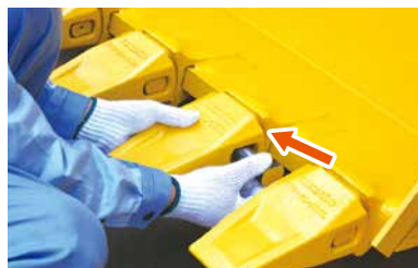
② ピン穴に専用ピンを挿入