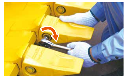
③ 専用ピンにブッシュ、ワッシャ、ボルトをセットし、ラチェットで締め付け ※ボルトの締め忘れに注意ください。